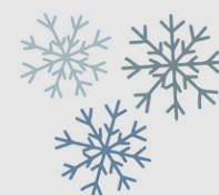
QUELQUES PETITS FLOCONS