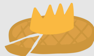
LA GALETTE DES P'TITS ROIS

PHILLIE VOUS PRÉSENTE LE KIT DE SURVIE EN 6 MAGNETS POUR CE MOIS DE JANVIER. 🙈