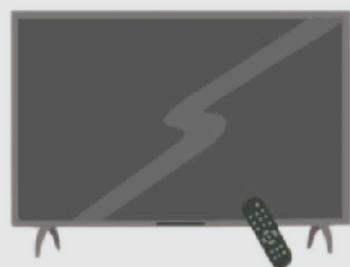
FILMS EN FAMILLE