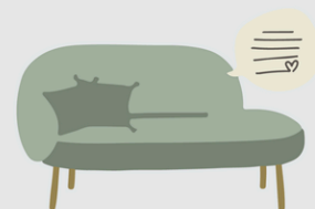
UN BON CANAPÉ